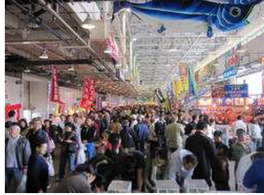
港町まつり会場(魚市場内)