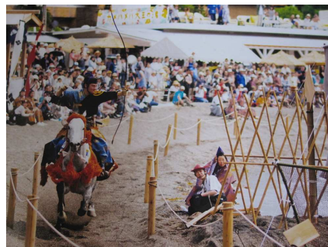
最優秀【注目の一瞬】

2月19日(木)みうら観光写真コンクールの審査会を行い、今年度の入選作品が決まりました。応募状況については、応募者数21名で応募点数は55点になりました。最優秀1点、特選2点、準特選2点、佳作5点。今年度より、地域賞を新設し、5点選ばれました。尚、表彰式は、3月29日(日) 三浦市観光インフォメーションセンターで行われます。