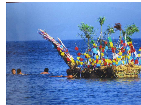
特選【沖に出た精霊舟】