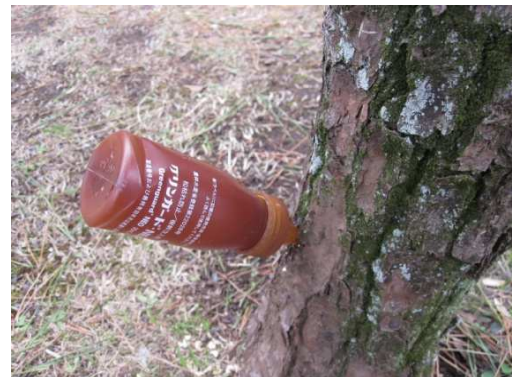
松枯れ防止樹幹注入剤 「グリーンガード・NEO」