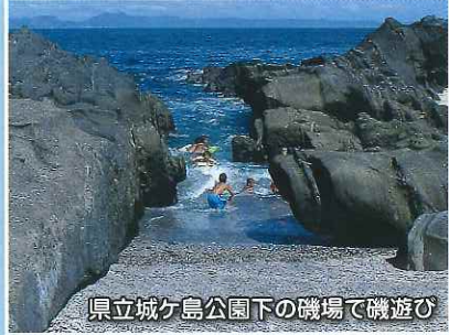
県立城ヶ島公園下の磯場で磯遊び