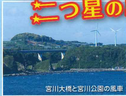
宮川大橋と宮川公園の風車