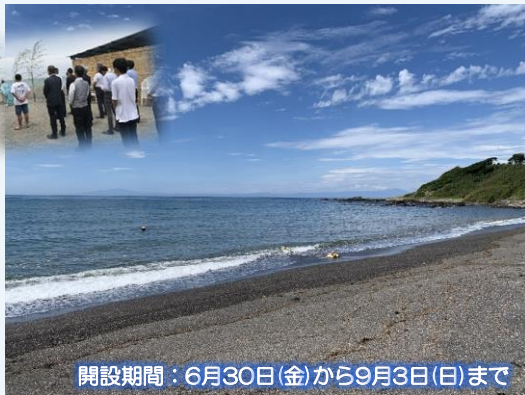
開設期間：6月30日(金)から9月3日(日)まで

和田浜（三浦市側）と長浜（横須賀市側）、ふたつの浜からなる約325mの海岸で、ゆるやかなカーブと奥行きが特徴です。背景の松林が鮮やかな緑色が美しいコントラストを作り、ロケーションも最高。長浜には、岩場もあるため、磯遊びも楽しめます。三浦半島の中では比較的透明度の高いビーチです。