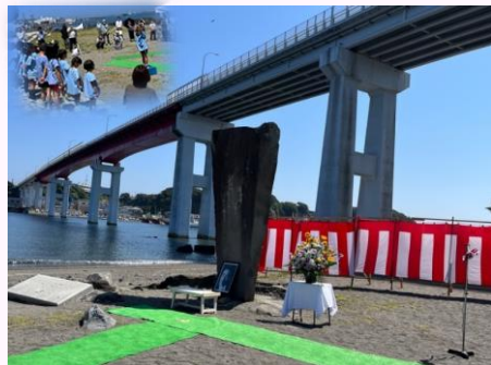
日時：7月11日(火) 10時00分～ 場所：城ヶ島大橋下・白秋詩碑前

三崎をこよなく愛した詩人・北原白秋を追慕す「みさき白秋まつり」の幕開けを飾る碑前祭です。献花のほか、城ヶ島保育園の園児による白秋ゆかりの歌披露などが行われました。