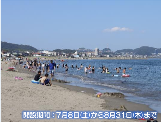
開設期間：7月8日(土)から8月31日(木)まで

三浦半島で最大規模の広いビーチは、駅からも近く、シーズン中はファミリーをはじめ、多くの海水浴客で賑わいます。8月には、「三浦海岸納涼まつり花火大会」が開催され、毎年、数十万人の観光客が夏の夜空を彩る大輪の華に酔いしれます。北は津久井浜、南は菊名海岸に隣接し、三浦半島の東京湾側では最大のビーチ。