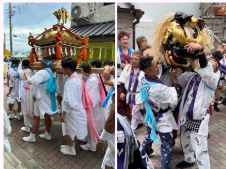
日時：7月15日(土)・16日(日) 場所：三崎町

三浦市指定重要無形民俗文化財に指定されている、江戸時代より挙行されてきた祭礼です。行道（お練り）獅子、木遣り唄での神輿渡御、獅子行道、山車巡行などが行われました。