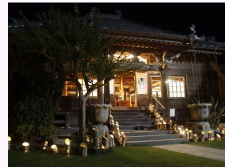
日時：7月28日(金)～30日(日)など 場所：福泉寺ほか

先祖供養の一つである七夕にちなんだイベント「盆竹灯籠まつり」が、三浦半島の5寺院（初声・福泉寺／芦名・浄楽寺／長井・不断寺／武山・東漸寺／葉山・長運寺）でリレー開催されました。