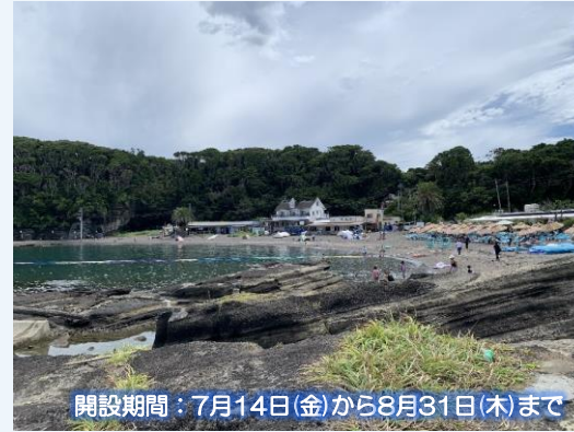
開設期間：7月14日(金)から8月31日(木)まで

2001年に「日本の水浴場88選」にも選ばれた荒井浜。相模湾を見渡せるビーチは入江形状で、こじんまりしていますがプライベートビーチのようです。また、毎年5月の最終日曜には三浦一族を偲ぶ「道寸まつり（笠懸）」が行われる風光明媚な浜としても知られています。