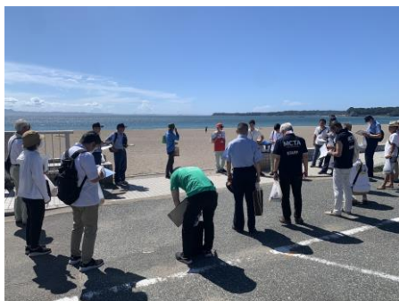
三浦海岸海水浴場

8月17日（水）午前、三浦地区海水浴場等対策協議会による海水浴場等パトロールが行われ、観光協会も参加しました。安全で快適な海水浴場及とするため、遊泳・マリンスポーツ・バーベキュー実施の多少や、ゴミ投棄(炭・タバコ含む)などを確認しました。