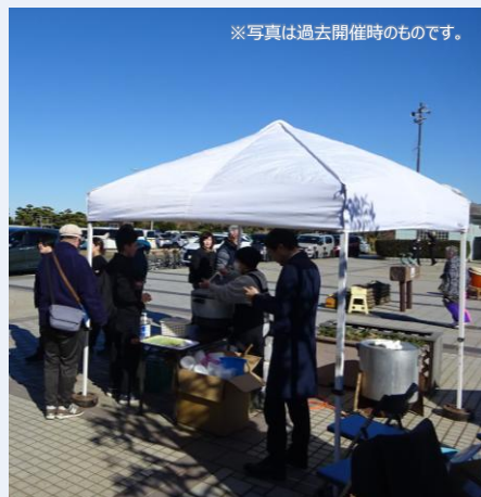
※写真は過去開催時のものです。