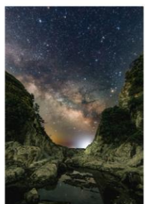
【準特選】「岩間から昇る」