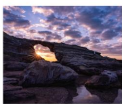
【地域賞】「洞門の夜明け」